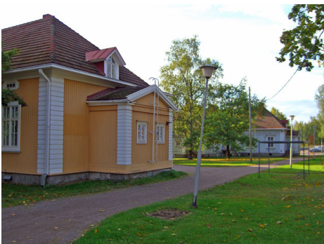
Kommila-Kosulanniemen asuinalue; Tienvarsi I. Jouni Marjamäki 2006

Pohjois-Savon kulttuuriympäristö osa 2. Pohjois-Savon kulttuuriympäristöselvitys. Pohjois-Savon liitto 2009.